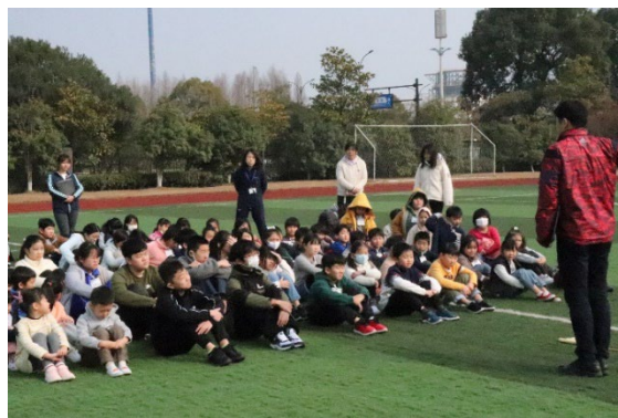
素早く整列し、静かに指示を待ちました。