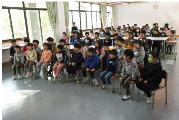
真剣に話を聞く園児児童生徒の様子