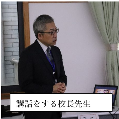
講話をする校長先生

1948年12月10日に国際連盟において世界人権宣言が採択されたことを記念して、毎年12月4日から10日は人権週間になっています。今月の全校朝会では、校長先生から人権についての講話がありました。