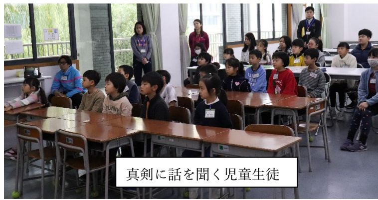
真剣に話を聞く児童生徒