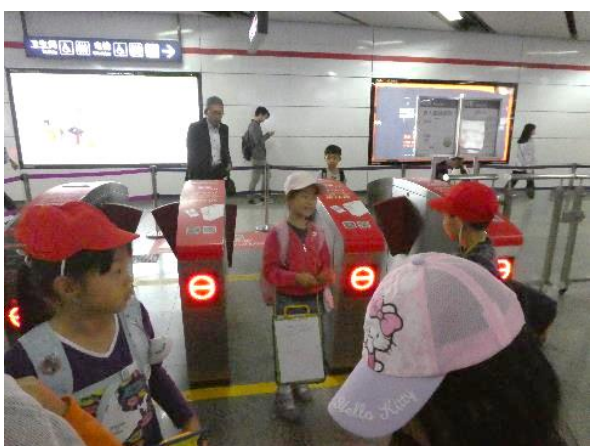
自動改札口を無事通ってホッと安心