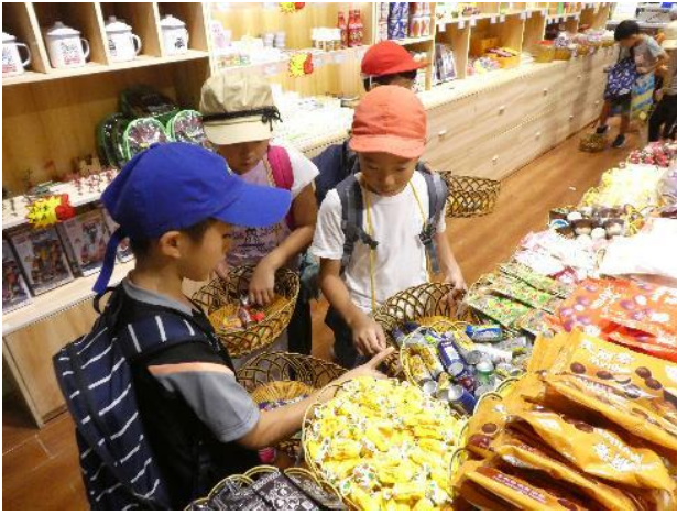
お買い物体験もしました。(1・2年)