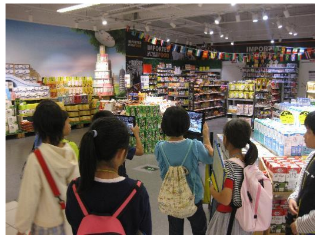
店内を詳しく観察します。(3年)