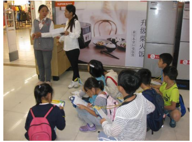
スーパーで係の方にインタビュー(3年)