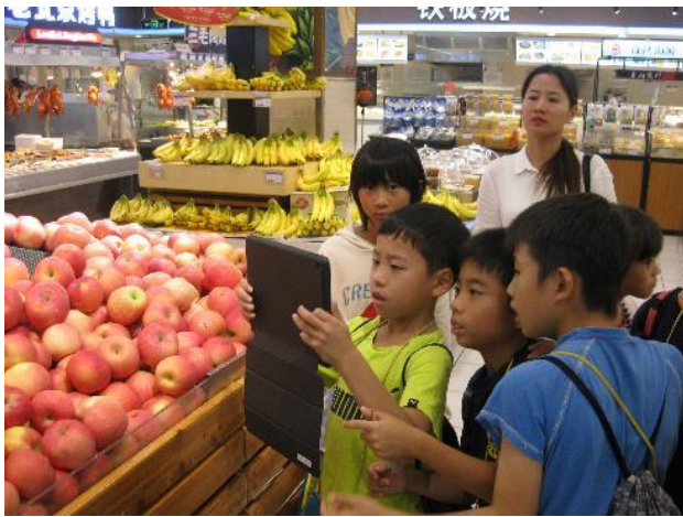
i P a dを使ってお店の工夫を記録(3年)