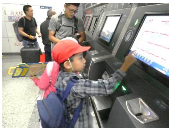
地下鉄の自動券売機で切符を購入