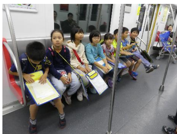
乗車中のマナーも大切