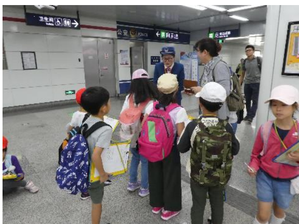
駅の係の方にインタビュー (1・2年)