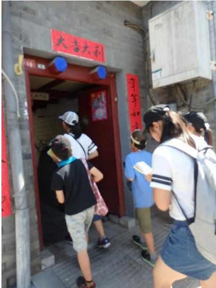
北京胡同で民家を訪問