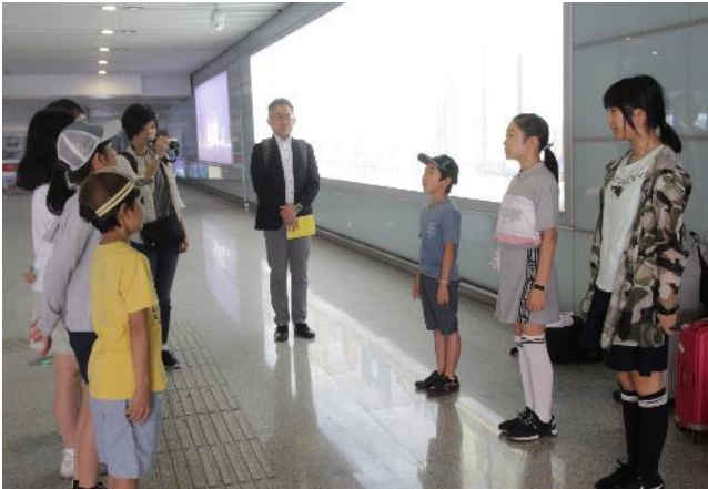
杭州東駅で出発式

本校では6年生と8年生(中学部2年生)が合同で修学旅行に行きました。今年は中国の首都「北京」を訪れました。北京は万里の長城・故宮博物院などの世界遺産や天安門広場、王府井大街など見どころの多い街です。壮大な歴史を持つ数々の史跡と、発展を続ける近代的な街並みの双方が楽しめる魅力的な都市でもあります。子どもたち一人一人がテーマをもって事前学習に取り組んできており、現地で自分の目と耳で確かめることで、学ぶことの多い旅行となりました。