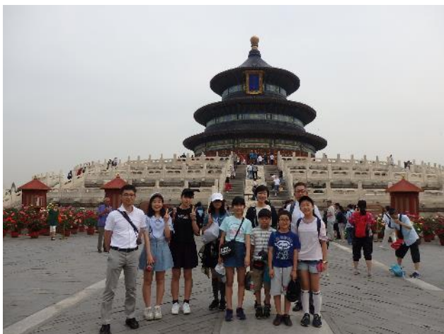
世界遺産「天壇公園」