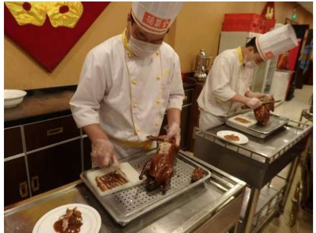
北京で北京ダック