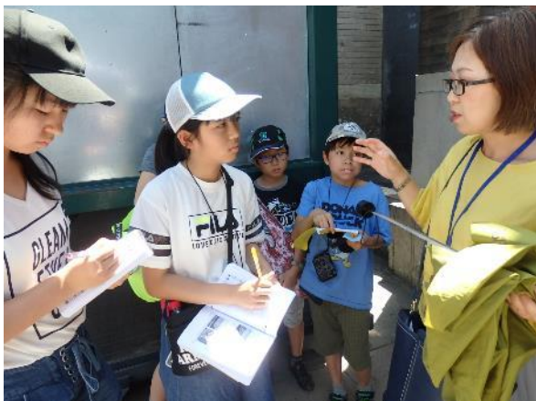
ガイドさんの説明を熱心に聞き、メモを取ります