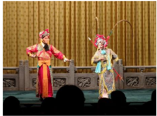
中国伝統芸能の京劇を鑑賞