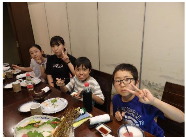
北京最後の食事は和食