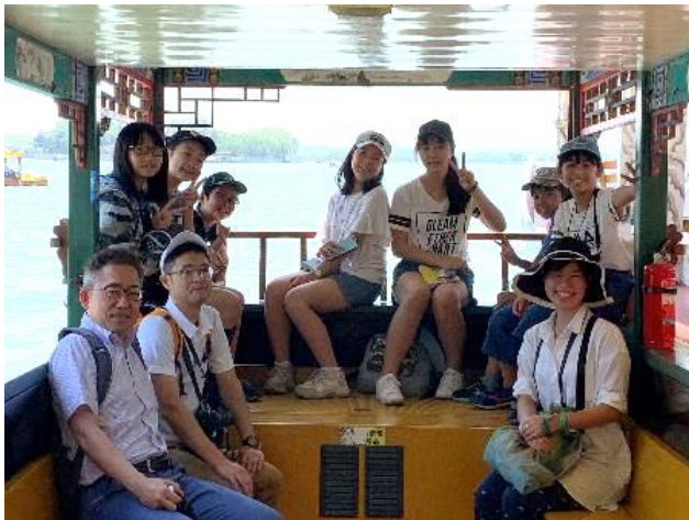
頤和園では遊覧船に乗船