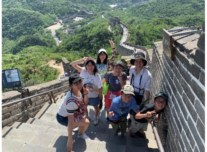
あまりにも雄大な万里の長城に感動