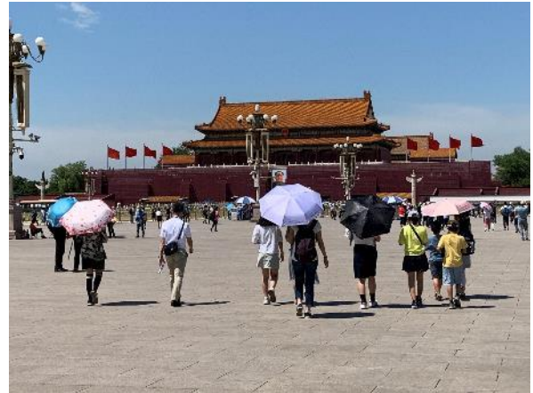
天安門広場から故宮博物院へ