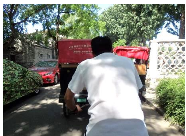
輪タクに乗車して北京胡同めぐり